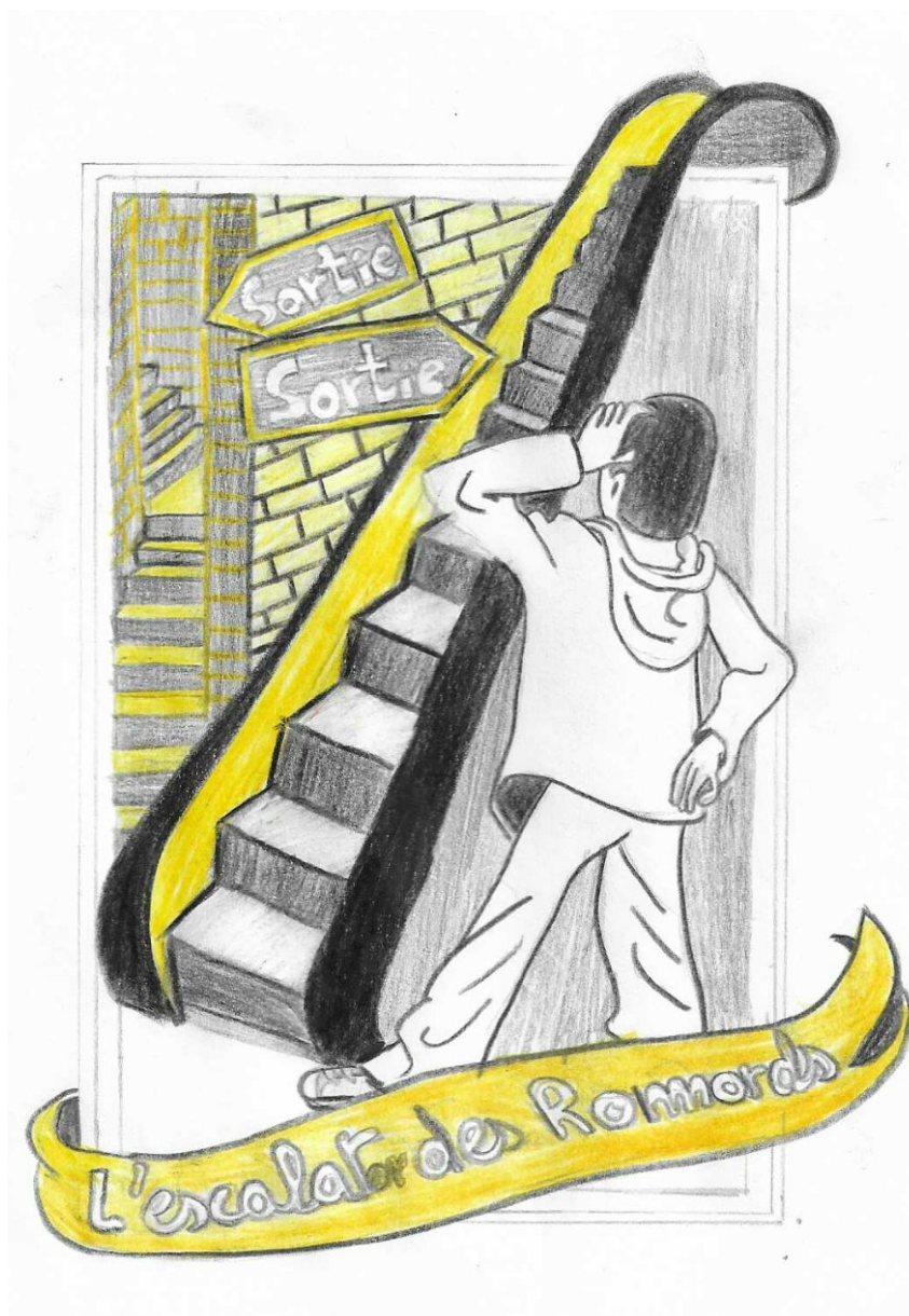
Soanelha a redessiné l'illustration de Killoffer, « L'escalator des remords ».